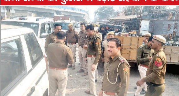
रेवाड़ी। राजस्थान पुलिस के साथ सर्व ऑपरेशन चलाते हुए जिला पुलिस के अधिकारी।

हरियाणा और राजस्थान के सीमावर्ती गांव में उतरी दोनों राज्यों की पुलिस