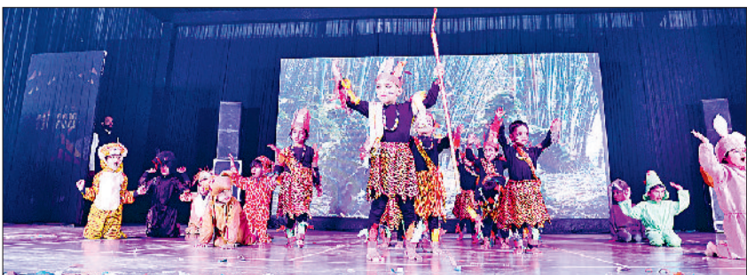
सांस्कृतिक कार्यक्रम पेश करते बच्चे