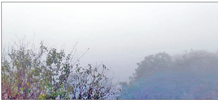
रेवाड़ी। रविवार सुबह आसमान में छाया घना कोहरा तथा ठंड से बचाव के लिए अलाव तापते हुए लोग।

तापमान 4 डिग्री सेल्सियस पर आ गया था। शनिवार को यह 4.5 डिग्री सेल्सियस बढ़कर 9.5 डिग्री पर पहुंच गया। रविवार को न्यूनतम तापमान में एक बार फिर से कमी दर्ज की गई। यह 4.3 डिग्री सेल्सियस की कमी के साथ 5.2 डिग्री सेल्सियस दर्ज किया गया। अधिकतम तापमान 23.5 डिग्री सेल्सियस रहा। अधिकतम तापमान इस बार 21 डिग्री सेल्सियस से नीचे नहीं आया है। गत वर्ष 24 दिसंबर को अधिकतम तापमान 17 डिग्री और न्यूनतम 5 डिग्री सेल्सियस दर्ज किया गया था। दिन के समय सुबह से ही तेज धूप खिलने के बाद दोपहर तक मौसम गर्म हो जाता है। गर्म वज्र तक दोपहर तक शरीर को चुभने लगते हैं। सुबह और शाम के समय ही ठंड का