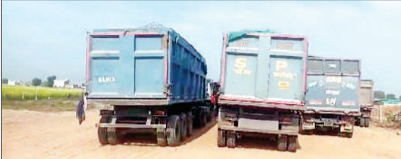
रेवाड़ी। नेशनल हाइवे पर पकड़े गए ओवीलॉड डंपर।

विशेष जांच करते हुए उन्हें नियमित रूप से अपनी रिपोर्ट भेजेंगे। ट्रांसपोर्ट डिपार्टमेंट की ओर से ऐसा ही प्रयोग कुछ समय पूर्व रेवाड़ी में भी किया था। उस समय दूसरे जिलों के आरटीए अधिकारियों की टीमों ने अवैध रूप से वाहन चलाने वाले लोगों में खलबली पैदा कर दी थी। एक ही रात में दिल्ली-जयपुर नेशनल हाइवे पर 100 से अधिक अवैध रूप से संचालित बसों को इंपाउंड किया गया था। स्पेशल चेकिंग के