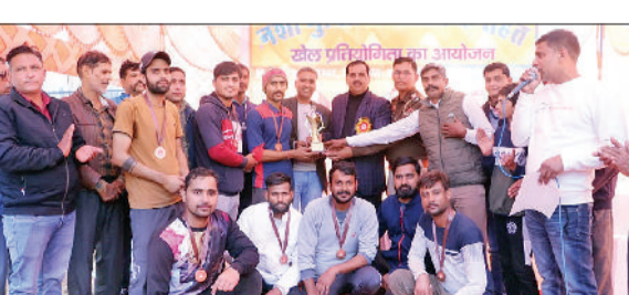
रेवाड़ी। विजेता टीम डीएसपी व अन्य अतिथियों के साथ।