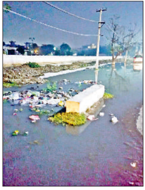
रेवाड़ी। धारूहेड़ा में फिर आया राजस्थान का दूषित पानी।