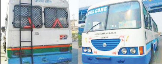
रेवाड़ी। दिल्ली-जयपुर नेशनल हाइवे पर चलने वाली रोडवेज से मिलती-जुलती प्राइवेट बसें।