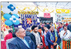
रेवाड़ी। कैप में अतिथियों का सम्मान करते आयोजक तथा कैप में महिला की आंखों की जांच करते हुए।