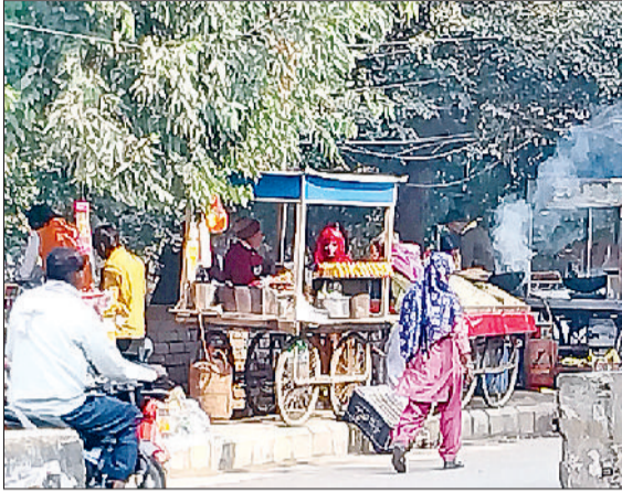
रेवाड़ी। बस स्टैंड के बाहर फुटपाथ पर रेहड़ियों का कब्जा व रेलवे रोड पर सड़क पर दुकानदारों का अतिक्रमण व रेलवे रोड पर सड़क पर दुकानदारों का अतिक्रमण।

शहर के सरकुलर रोड व बाजारों में लंबे समय से व्याप्त अतिक्रमण का नासूर खत्म होने का नाम नहीं ले रहा है। प्रशासन की ओर से भी इस समस्या के समाधान करने में कोई दिक्कत नहीं ली जा रही है। नगर परिषद की मेहरबानी से शहर में अतिक्रमणकारियों के हौसले काफी बुलंद हो चुके हैं। सरकुलर रोड पर फुटपाथों पर रखा सामान, खड़ी रेहड़ियां व फुटपाथ के आगे सड़क पर वाहनों की अवैध पार्किंग ने शहर की पूरी व्यवस्था बिगाड़ कर रख दी है। अतिक्रमण के कारण शहर के मोती चौक से गोकल गेट के बीच के बाजार की सबसे ज्यादा स्थिति खराब हो रही है। अतिक्रमण के कारण बाजार की करीब 60 से 70 फीट की सड़क मात्र 10 फीट में सिमट कर रह गई है। बाजारों में जहां दुकानदारों ने अपनी दुकानों के आगे तख्त लगाकर अतिक्रमण किया हुआ है वहीं रेहड़ी वाले मनमर्जी की जगह अपनी रेहड़ी खड़ी करके लोगों के लिए परेशानी पैदा कर रहे हैं। शहर को अतिक्रमण व जाम मुक्त बनाने के लिए प्रशासन के दावे हर बार फेल