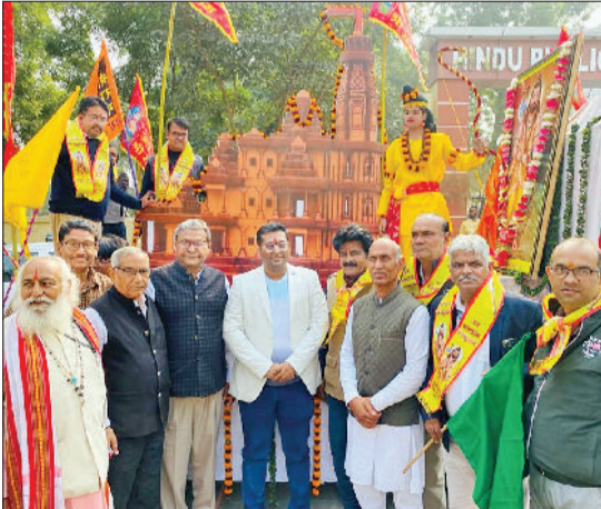
रेवाड़ी। झांकी के साथ ब्राह्मण सभा के सदस्य।