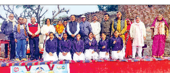
रेवाड़ी। प्रतियोगिता के विजेताओं को सम्मानित करते हुए।