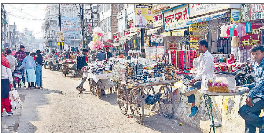
रेवाड़ी। गोकल बाजार में डेवाइडर की आड़ में लगाई गई रेहड़ियां व बाजार में एक तरफ दुकानदारों व दूसरी ओर रेहड़ियों का अतिक्रमण।

होते रहे हैं, जिसमें नगर परिषद की सुस्त कार्यशैली अपनी अहम भूमिका निभा रही है। अतिक्रमण मुक्त बनाने की दिशा में नगर परिषद की ओर से कोई भी ठोस कदम उठाए जाने की बजाय सिर्फ कार्रगों में योजनाएं बनाई जा रही हैं। सड़कों, फुटपाथ व बाजारों में पूरी तरह दुकानदारों, रेहड़ी और